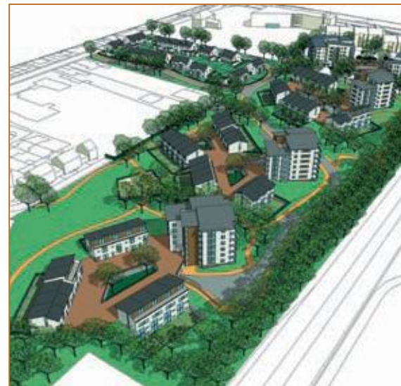
Rosa de Lima: een woongebied met 200 woningen.

Stedenbouwkunde staat natuurlijk nooit helemaal op zich. Er zijn raakvlakken met vele vakgebieden, waarvan de architectuur de meest in het oog springende is. Bij het maken van een stedenbouwkundig plan voor een locatie is het van groot belang om ook snel te kunnen schakelen naar andere disciplines. Op dit gebied kan bd architectuur zich onderscheiden. Naast kunde op het gebied van de architectuur hebben we ook de nodige kostendeskundigheid in huis om zo de haalbaarheid van de plannen te kunnen toetsen en desgewenst ook grondexploitatieberekeningen uit te voeren. Zo kunnen al in een vroege fase alle aspecten van een plan belicht worden wat een soepeler vervolg van het proces kan waarborgen.